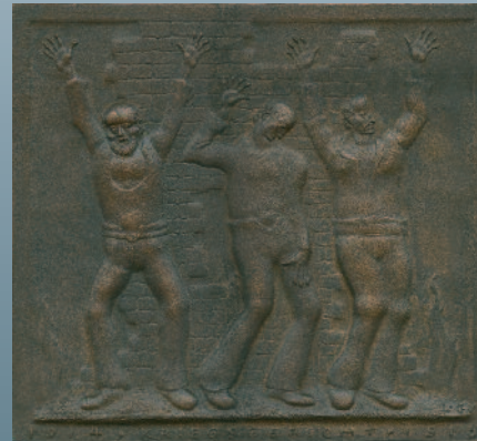
Ludwig Gies Kriegsgericht 1915

Neben das ebenso traditionelle illustrierte Flugblatt vergangener Jahrhunderte trat seit 1914 die Künstlergraphik als Bildbegleiter des Krieges. Zwar spiegeln manche Blätter offizielle Propaganda wider oder dienten dieser gar, doch wurden nicht wenige durch die seinerzeitige Zensur mißbilligt. Auf jene höchst individuellen Interpretationen konzentriert sich die nach Themen geordnete Auswahl von gut 300 Werken der 137 Graphiker: Im motivisch-thematischen Spannungsfeld zwischen trügerischer Idylle, schonungslos-brutaler Realitätskolportage und sinnsuchender Deutung kollidiert Patriotismus mit Skeptizismus, trifft Militarismus auf wachsenden Pazifismus.